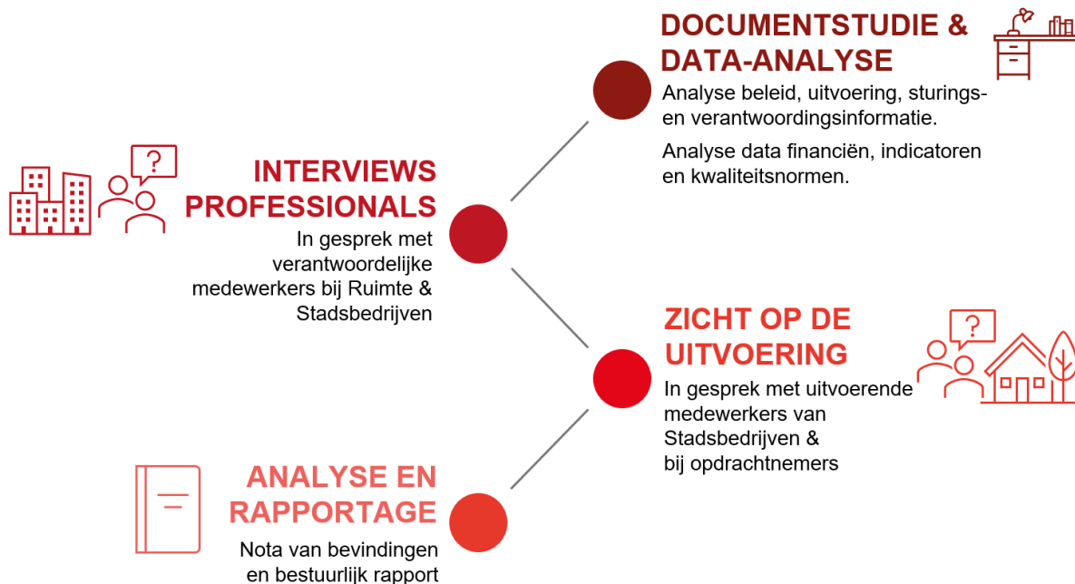
Figuur 4 Aanpak van het onderzoek in vier stappen.

Wij voeren het onderzoek uit aan de hand van vier onderzoekstappen (zie figuur 4). Deze stappen worden hieronder kort toegelicht.