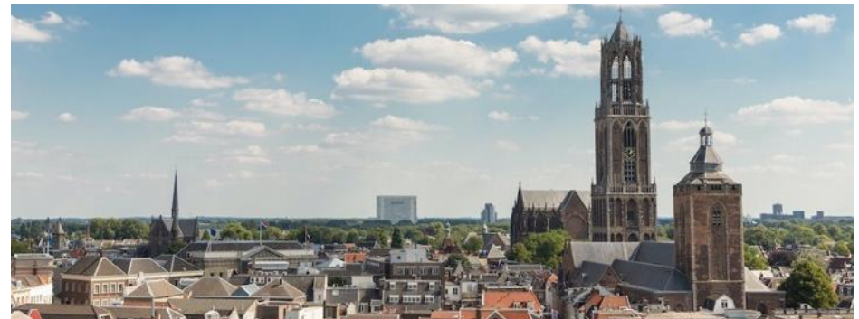
Randvoorwaarden: Utrecht is gekozen tot vrijwilligersstad van 2020. Veel bewonersinitiatieven draaien op vrijwillige inzet. De beleidsregel 'Vrijwillige inzet voor Elkaar' heeft een jaarlijks budget van € 6.800.000,-. Meer dan tachtig initiatieven worden hierdoor vanaf 2021 ondersteund.

Initiatieven zijn ván de stad. Initiatiefnemers hebben een direct belang bij hun initiatief, juist omdat het gaat om iets dat hen raakt, én hun omgeving. Initiatiefnemers zijn vaak klein, maar zeer krachtig. De organisaties worden soms kwetsbaar genoemd; maar in de praktijk hebben ze vaak een grote veerkracht en wil om te slagen. Dit hangt samen met de betrokkenheid: het is tenslotte hún initiatief.