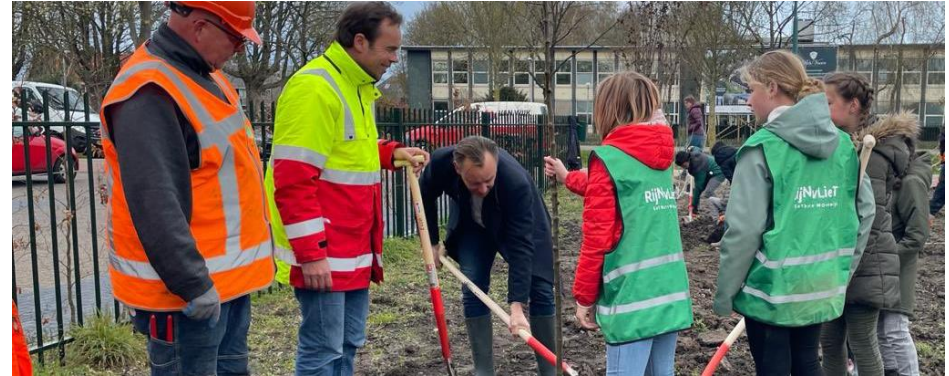
Een ontwerp of visie maken: Rijnvliet, eetbare wijk. De bewoners van de Rijksstraatweg en de Metaalkathedraal kwamen met het idee om in Rijnvliet een voedselbos te maken. Dit is samen met de gemeente uitgewerkt.