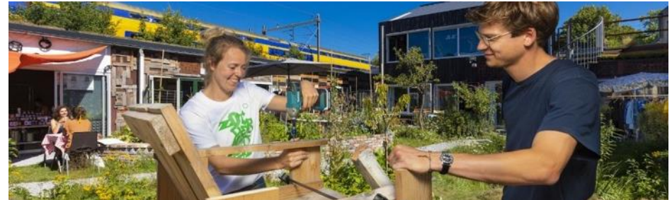
Een project opzetten: Het Hof van Cartesius is de groene werkplek in het Werkspoorkwartier. Sinds 2016 hebben creatieve en duurzame ondernemers hier hun eigen werkruimte rondom een groene binnentuin. Dit initiatief levert een grote bijdrage aan duurzaam bouwen in Nederland.