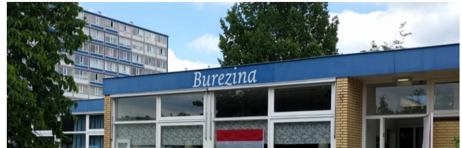
Een collectieve plek beheren: Tientallen initiatieven, bewonersorganisaties en verenigingen hebben aangegeven het eigenbeheer van maatschappelijk vastgoed te willen doen. Daarvoor is een beleidskader ontwikkeld en ondersteuningsbudget vrijgemaakt voor o.a. het Dwarsverband.