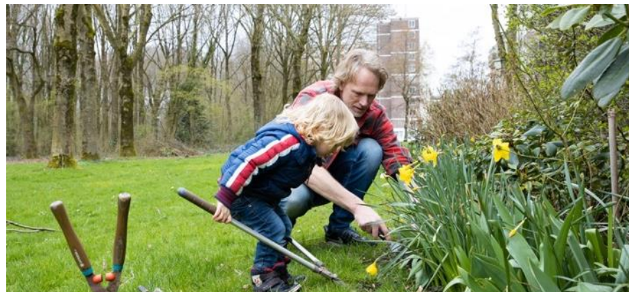
Voorbeeld zelfbeheer groen. De gemeente is een campagne gestart om meer inwoners van Utrecht te vinden die openbaar groen in hun eigen buurt willen onderhouden en beheren. Vrijwilligers, buurtambassadeurs en coaches werken aan een schoon Utrecht, zonder zwerfval.

Wel beter, niet meer geld. Veel van de genoemde acties vragen om personele inzet. Soms is dit een onderdeel van regulier werk. Soms is extra inzet en een andere prioritering nodig. De uitvoering van deze activiteiten vindt vaak plaats binnen de huidige gemeentelijke budgetten. Dat legt beperkingen op. We zullen moeten selecteren en faseren, in overleg met de partners in de stad.