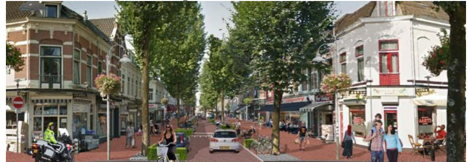
Een ontwerp of visie maken: Bewoners én ondernemers maakten samen een buurtvisie voor de Kanaalstraat en Damstraat. De gemeente ondersteunde door een procesbegeleider en stedenbouwkundig specialisten.