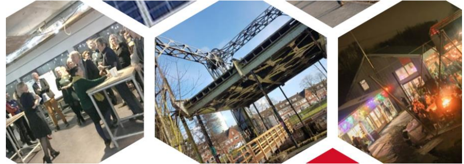
Zeggenschap en verantwoordelijkheden: Diverse partijen in de stad, zoals TransitieMotor030 en de Utrechtse Ruimtemakers, maken zich hard voor meer zeggenschap en verantwoordelijkheid bij inwoners.