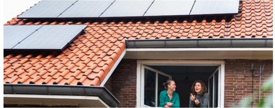
Een project opzetten: Bewonersgroep Karel Doormanlaan-duurzaam werkt collectief aan energiebesparende maatregelen in Noordoost. In deze buurt wordt gewerkt aan gezondheid, luchtkwaliteit, vochtproblemen in de huizen.