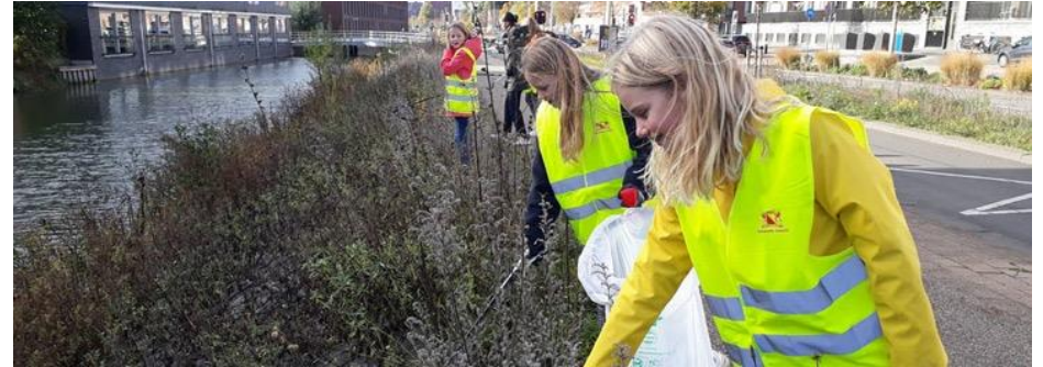
Inwoners van alle leeftijden en alle wijken zetten zich in voor een groene stad zonder zwerfafval.

De gemeente wil samen met een diverse groep initiatiefnemers in de stad een werkgroep oprichten die zich bezighoudt met het gelijke speelveld tussen de bewoners onderling. De werkgroep doet voorstellen hoe om te gaan met vraagstukken over inclusiviteit bij zelfbeheer (4.1), participatievereisten bij een eigen visie of ontwerp (4.3), strijdige initiatieven en daaruit volgende spanningen in een buurt of wijk en vermeerdering van initiatieven uit bepaalde groepen van de samenleving die nu met weinig of geen initiatiefprojecten (4.4) komen.