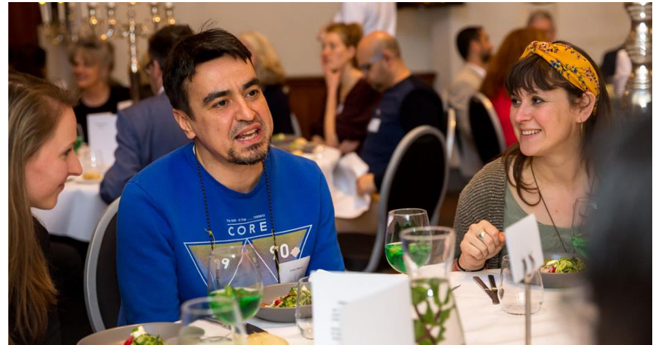
Een dienst aanbieden: Er is door Taal doet Meer een nieuw aanbod ontwikkeld voor werkgevers. Eigen medewerkers worden opgeleid tot taalmaatje op de werkvloer van een bedrijf. Het Oranjerfonds financiert dit en vanuit de gemeente is er inzet van bedrijfsadviseurs van WSP (werkgevers servicepunt).

In participatieprocessen zien we wensen om niet alleen te kunnen reageren op een extern of gemeentelijk voorstel, maar ook om zelf een ontwerp of een visie te kunnen maken. Hiermee krijgt de initiatiefnemer een zogenaamde adviesrol, waarbij een ontwerp of visie het resultaat is. De kracht van lokale kennis en directe inpassing van lokale belangen is een voordeel. De initiatiefnemer werkt vanuit een andere ervaring en positie, maar wel binnen dezelfde kaders als de gemeente, of wanneer dit zou zijn uitbesteed aan een extern adviseur zoals een ontwerper of consultant. De verbinding met de gemeentelijke verantwoordelijkheid is hier van belang: de formele rol van het college en/of de gemeenteraad zijn bij wet vastgelegd.