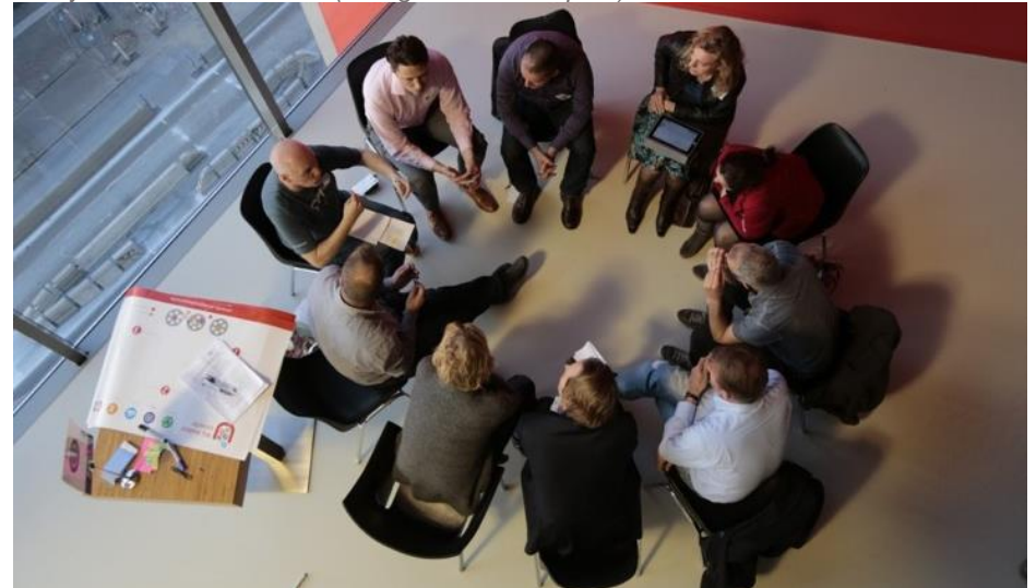
Een dienst aanbieden: De debatfunctie in de bibliotheek wordt verzorgd door 'Utrecht in dialoog' een stadsinitiatief dat de status 'initiatief' inmiddels voorbij is.