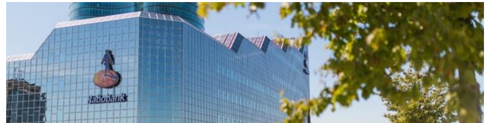
Zeggenschap en verantwoordelijkheden: Rabobank Utrecht heeft een maatschappelijke fonds en een Wijkenplan, beide om maatschappelijke initiatieven duurzaam mogelijk te maken.