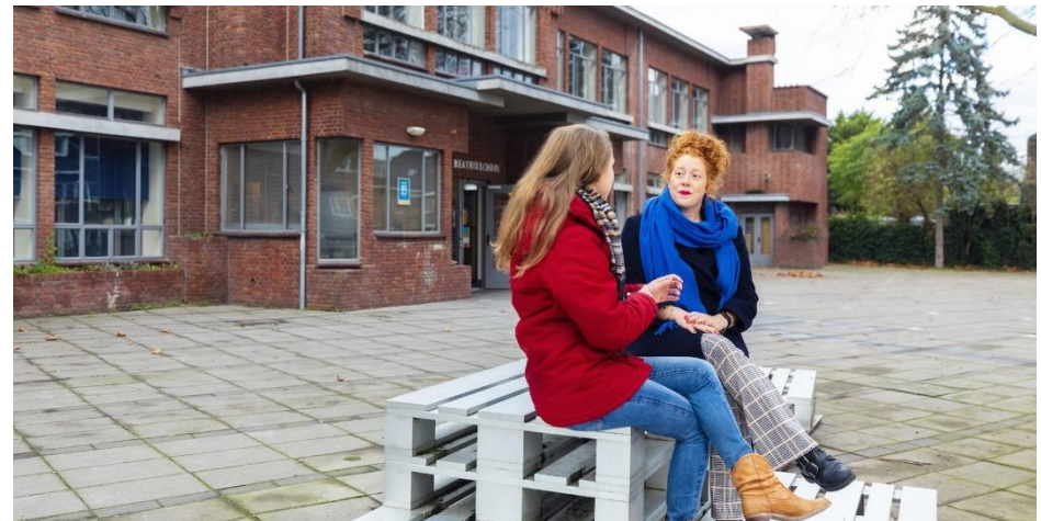
Een dienst aanbieden : Verschillende bewonersinitiatieven en sociaal ondernemers wilden doorgroeien naar zorgaanbieder dagbegeleiding. Met de pilot bewonersbod op dagbegeleiding is dit op professionele en principiële gronden niet gelukt (zie ook de 2 e voortgangsrapportage Samen stad maken).