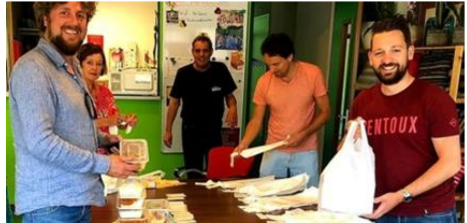
Randvoorwaarden: Er zijn ook grote maatschappelijke of zakelijke organisaties, samenwerkingsverbanden en belangengroepen met een coöperatieve insteek. Via Voor je Stadsie maken initiatieven kans op 'social return' bijdragen van bedrijven die aanbesteden binnen de gemeente Utrecht. Zo ook het project "Koks koken voor Utrecht".