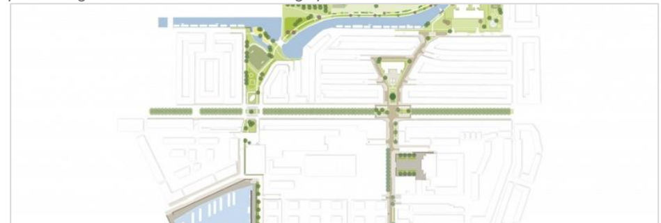
Een ontwerp of visie maken: Drie bewoners met kennis over landschapsinrichting uit Dichterswijk bedachten om diverse groene plekken in de wijk met elkaar te verbinden. Bewoners regelden zelf communicatie en draagvlak. De gemeente droeg bij in een uitvoeringssubsidie.