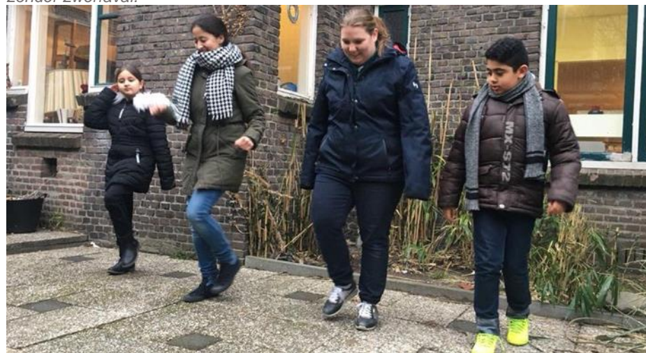
Wishing Well West is één van de organisaties die aanvankelijk via bewonersbod een plek heeft gekregen in het welzijnswerk. Verschillende bewonersinitiatieven ontvingen uit meerdere subsidieregelingen een bijdrage en hadden te maken met verschillende ambtenaren. Op hun verzoek is er gewerkt aan een systeem van zoveel mogelijk één zogenoemde accounthouder en één clusterbeschikking. Hierdoor is de administratieve last van jaarlijks aanvragen en verantwoorden vereenvoudigd.