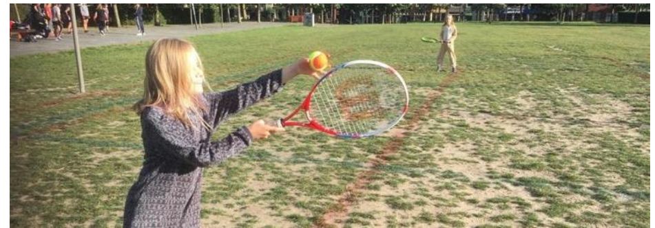
Een project opzetten: kinderen, en sinds kort ook jongeren, kunnen makkelijker initiatieven aanvragen bij het initiatievenfonds. Bijvoorbeeld voor een (tijdelijke) speelplek in de wijk.