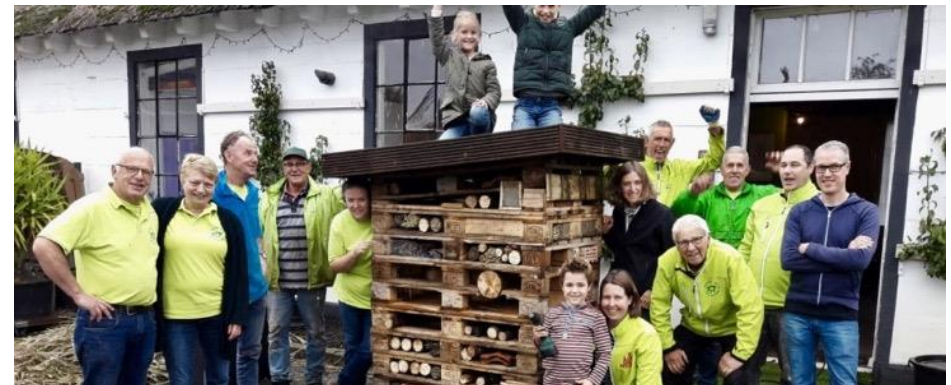
Een collectieve plek beheren: In het Maximapark zijn diverse organisaties actief in het beheer en onderhoud en de ontwikkeling. Dit doen ze in samenspraak met en ondersteund door de gemeente. Hier een foto van de Vrienden van het Maximapark.