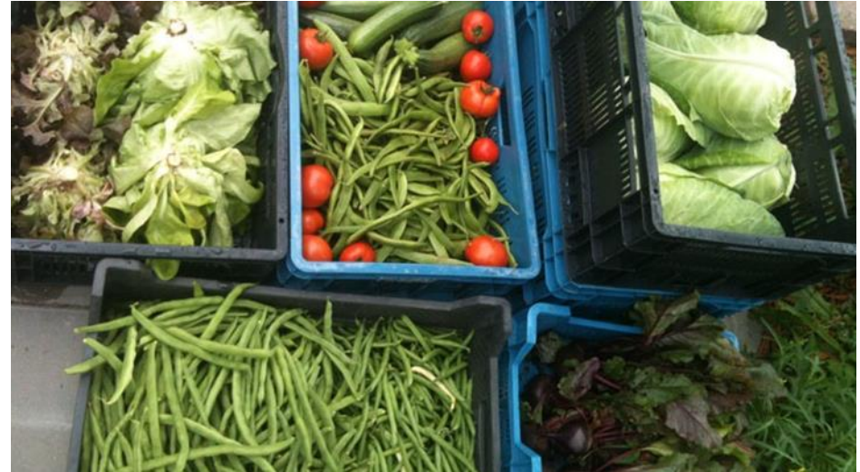
Een collectieve plek beheren : Vrijwilligers van Food for Good beheren groen én werken aan een gezond Utrecht. Food for Good past niet in één hokje, het dient meerdere doelen!