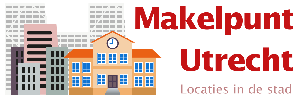
Een project opzetten: Projecten die ruimte nodig hebben kunnen terecht bij het Makelpunt van de gemeente Utrecht. Er worden jaarlijks ongeveer 250 matches gemaakt met aanbieders van ruimte, waarvan ongeveer een derde in gemeentelijk vastgoed als tijdelijk beheer.