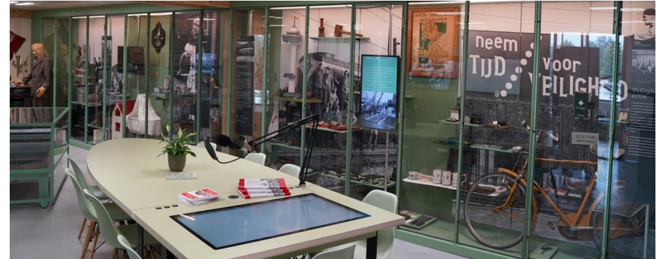
Een project opzetten: Een bewonersinitiatief, sterk gedreven door een klein team, op zoek naar versterking. Op deze foto staat het Museum van Zuilen (nieuwe locatie).