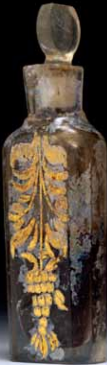
Achttiende-eeuws parfumesje, waar deels de parfumesje nog in zit. Het flesje is gevonden bij de Walsteeg.

De Utrechtse bodem zit vol waardevolle resten uit het verleden. Daarom mogen er vaak alleen onder bepaalde voorwaarden bouw- of grondwerkzaamheden worden verricht. Zo kan er eerst archeologisch onderzoek nodig zijn. Heeft u bouwplannen of bent u toevallig op een archeologische vondst gestuit? In deze folder leest u wat u in dergelijke gevallen moet doen.