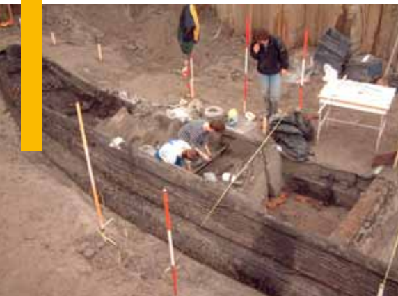
In 2003 is het Romeinse schip De Meern 1 geborgen. Het schip, dat nog geheel intact was met alle gereedschappen van de schipper er op aanwezig, zal vanaf 2015 in Castellum Hoge Woerd tentoongesteld gaan worden.

De archeologievergunning kunt u aanvragen met het formulier dat u kunt downloaden op www.utrecht.nl in het digitaal loket, onder product 'archeologie, vergunning en onderzoek'. Op het formulier staat aangegeven welke bijlagen u moet meesturen. De gemeente kan u nog vragen om extra stukken. Voordat u een archeologievergunning aanvraagt, kunt u het beste eerst overleggen met één van de gemeentelijke archeologen. Deze kan u vertellen welke stukken u bij uw aanvraag moet meesturen, hoe de procedure verloopt, en of u eventueel een archeologisch onderzoek moet laten uitvoeren. Dit overleg kan