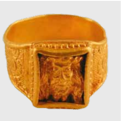
In 2005 werd bij onderzoek naar het Brigittenklooster een prachtige gouden ring gevonden. De vijftiende-eeuwse ring toont in reliëf het gelaat van Christus met de zegenende hand van God en een duif die symbool staat voor de Heilige Geest.