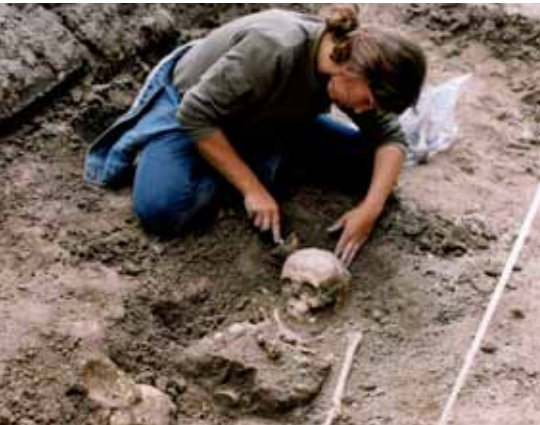
Voorafgaand aan de aanleg van de HOV-busbaan kwamen op het Janskerkhof verschillende middeleeuwse begravingen tevoorschijn.

Mogelijk moet u een archeologisch onderzoek laten uitvoeren voordat u een archeologievergunning kunt krijgen. Of en welk onderzoek noodzakelijk is, hangt af van uw situatie. U wordt geadviseerd om uw plannen zo vroeg mogelijk met de gemeente te bespreken, bij voorkeur voordat u een omgevingsvergunning en/of archeologievergunning aanvraagt. De gemeente zal u vertellen welk