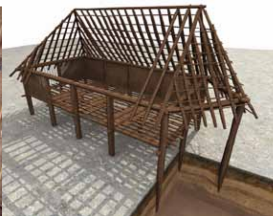
Reconstructie van een vroegmiddeleeuwse opslagschuur, gemaakt aan de hand van archeologische sporen.