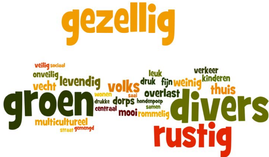
Afbeelding 5: Wordenwolk "Omschrijf Zuilen in drie woorden"

Er zijn meerdere nieuwe speelplekken gerealiseerd. Door diverse nieuwbouwprojecten zijn er veel nieuwe mensen in Zuilen komen wonen. Een belangrijke ontwikkeling die op stapel staat, is de ontwikkeling van het Sportpark Zuilenselaan, samen met de gemeente Maarssen.