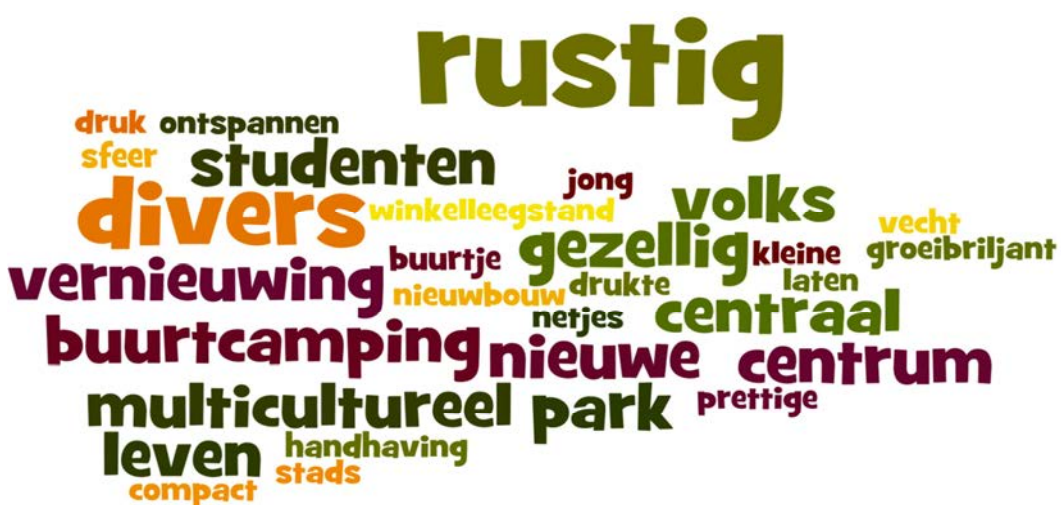
Afbeelding 3: Wordenwolk “Omschrijf Pijlsweerd in drie woorden”

Pijlsweerd ligt tegen de rand van de binnenstad en het stationsgebied. Het kenmerkt zich momenteel door een sterke gentrificatie; de buurt wordt de laatste jaren steeds ‘hipper’. Door onder meer nieuw- en verbouwprojecten (Oudenoord en Zijdenbalen) komen er meer mensen in Pijlsweerd wonen en veranderen de verkeerssituaties. Pijlsweerd krijgt steeds meer een centrumuitstraling. Er is veel verkeers- en parkeerdruk en weinig groen. Veel bewoners van Pijlsweerd zijn mondig en weten de gemeente goed te vinden met vragen en initiatieven. Er zijn enkele buurtjes waar de zelfredzaamheid minder groot is; de tweedeling is in dat opzicht in Pijlsweerd scherp. De speeltuinen en buurthuizen hebben een belangrijke functie, maar deze functioneren niet altijd even zelfstandig.