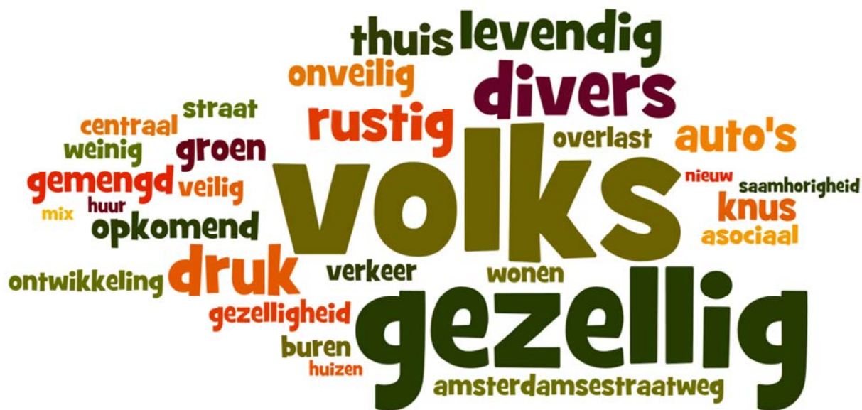
Afbeelding 4: Wordenwolk "Omschrijf Ondiep in 3 woorden"

De Hoogstraatbuurt heeft een heel eigen, karakteristieke sfeer. De buurt is de afgelopen jaren behoorlijk veranderd als gevolg van nieuwbouw. De oever van de Vecht heeft hier een ontmoetingsfunctie gekregen waarvan de oude en nieuwe bewoners gebruik maken. De bewoners van Hoogstraatbuurt zijn mondig en weten de gemeente goed te vinden.