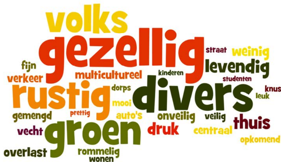
Afbeelding 1: Wordenwolk "Noordwest in drie woorden", afkomstig uit de enquête voor de wijkopgaven

Inwoners van Noordwest geven hun wijk gemiddeld een 6,3. Dat is onder het gemiddelde van Utrecht, een 7,1. Een kwart van de bewoners geeft aan het afgelopen jaar actief te zijn geweest om de buurt beter te maken. Het wijkbureau kreeg 146 aanvragen voor een bijdrage uit het Initiatievenfonds.