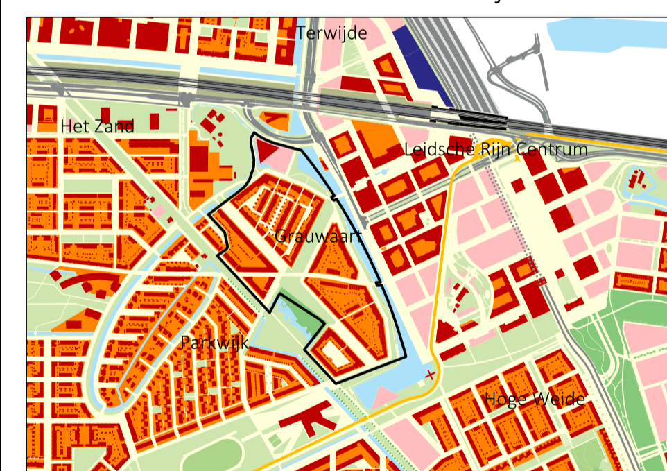
Grauwart en omgeving