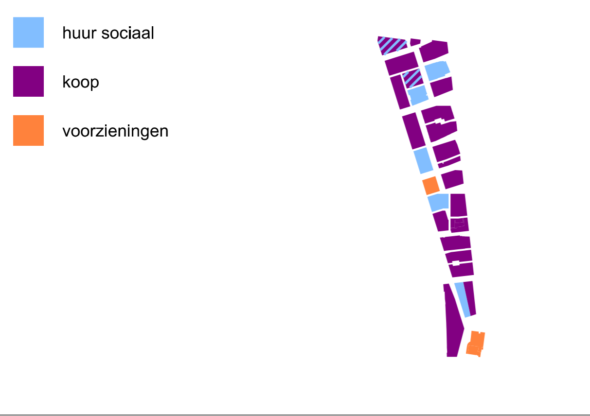
Overzicht huur / koop