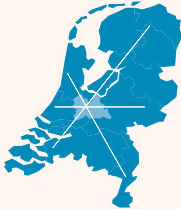
CENTRALE LIGGING LEIDSCHER RIJN CENTRUM