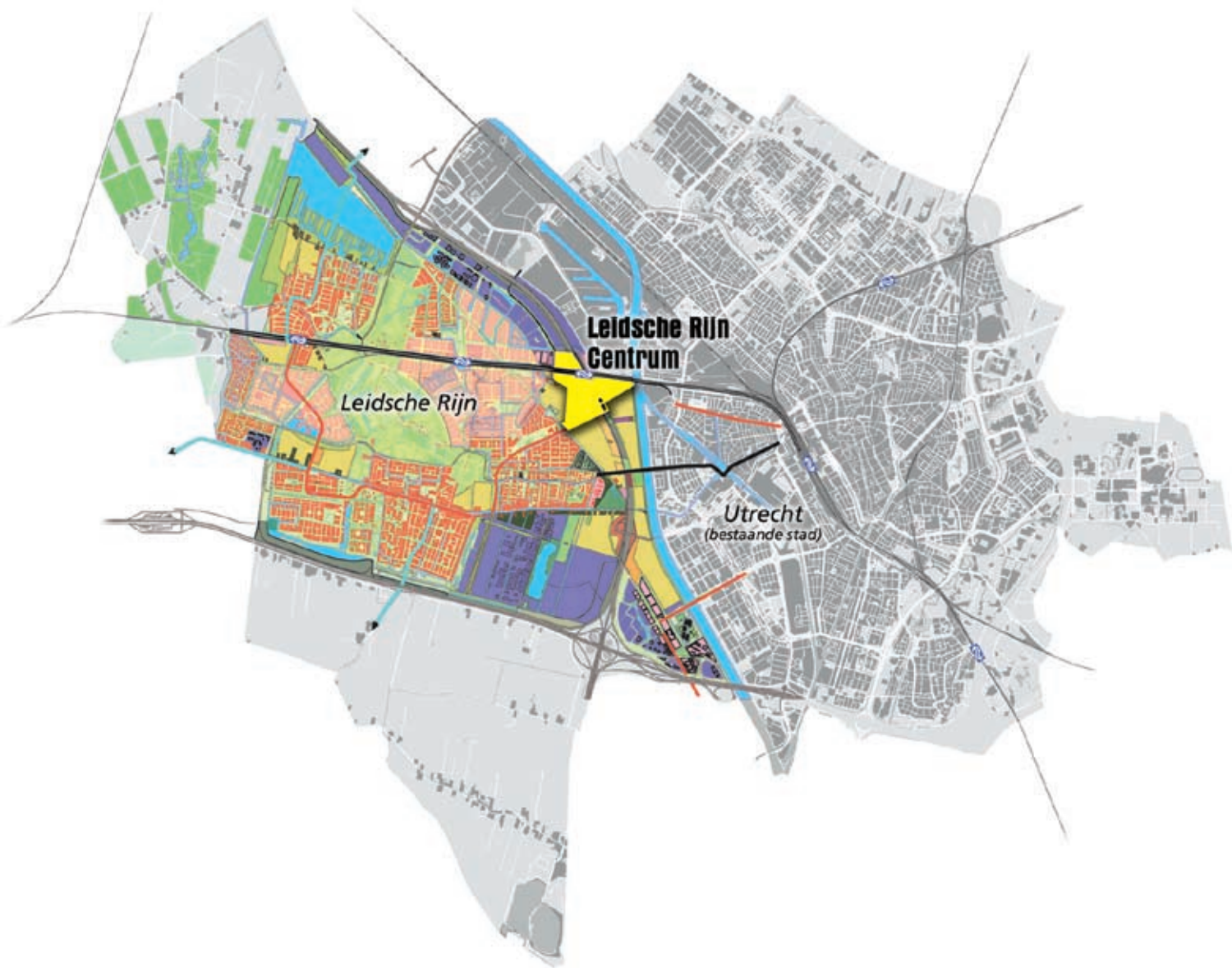
OVERZICHTSKAART GEMEENTE UTRECHT