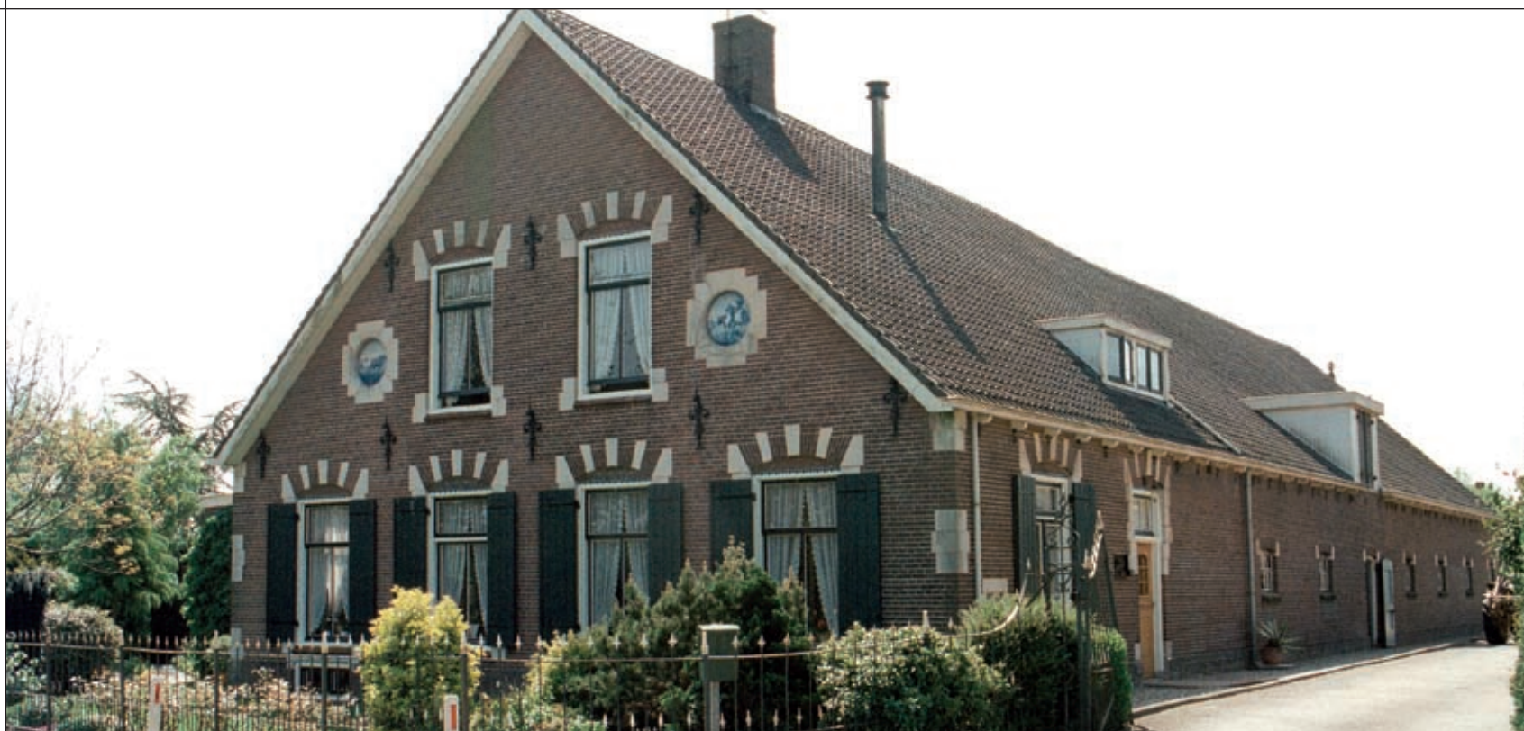
HOFSTEDE TER WEIDE