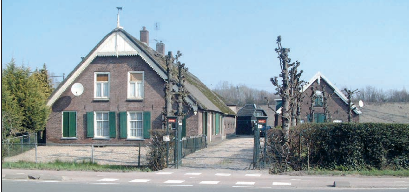
BOERDERIJ ROOD NOOT