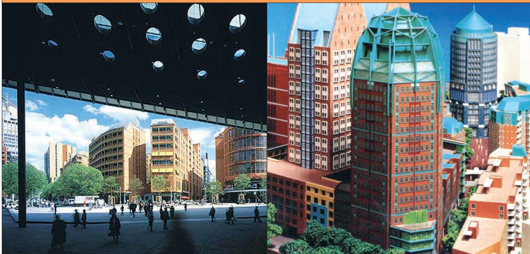
REFERENTIES 'TEN NOORDEN VAN HET SPOOR'