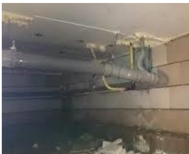
Regenpijp door de kruipruimte

Voorbeelden van regenpijpen die door de woning of kruipruimte lopen