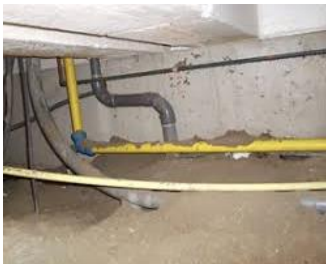
Regenpijp door de kruipruimte