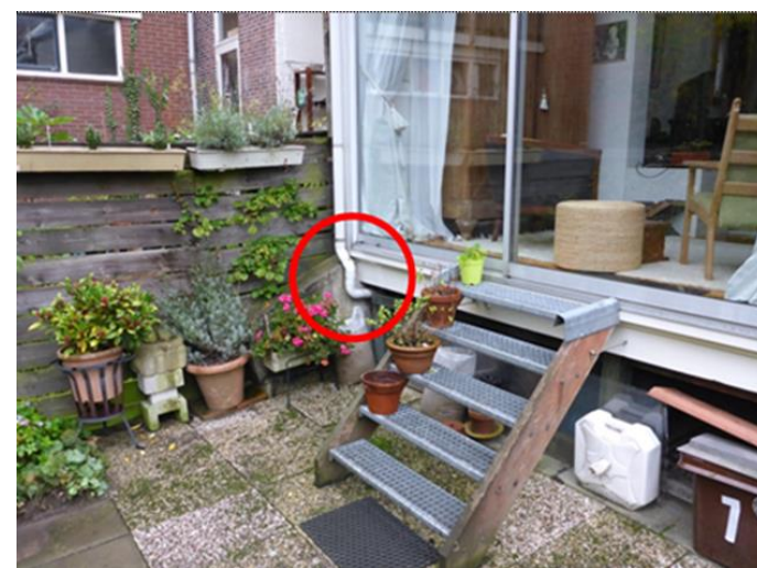
Afgekoppelde regenpijp van buitenaf gezien