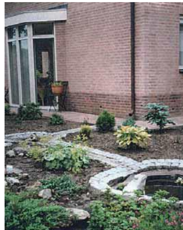
Een vijver als tijdelijke waterberging