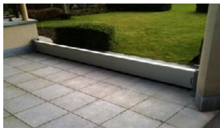
Een opstaand muurtje om het water te weren