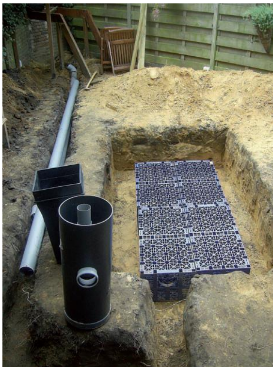
Een ondergrondse waterberging